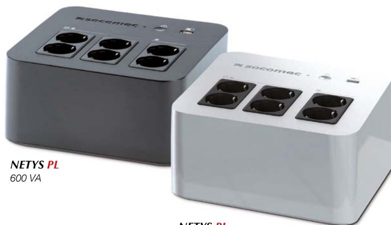
NETYS PL 600 VA